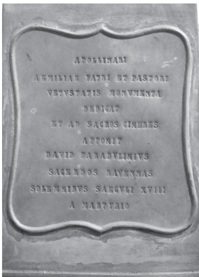
Immagine 2: la cassetta di zinco che contiene le opere di Mons. Farabulini

La seconda lamina (20,7 x 8,5 cm) ritenuta insieme alla terza opera del X secolo, entra nel vivo della vicenda agiografica del Santo ricordando la sua origine antiochiana, il suo invio a Ravenna e i miracoli da lui compiuti. Anche in questa lamina il testo è preceduto da una piccola croce: "+ Ortus ab Antiochia beatus Apolenaris a summo apostolorum principe Ravennam missus est predicare baptismum penitentiae in remissionem peccatorum ibique per eum dominus virtutes multas operatus est nam