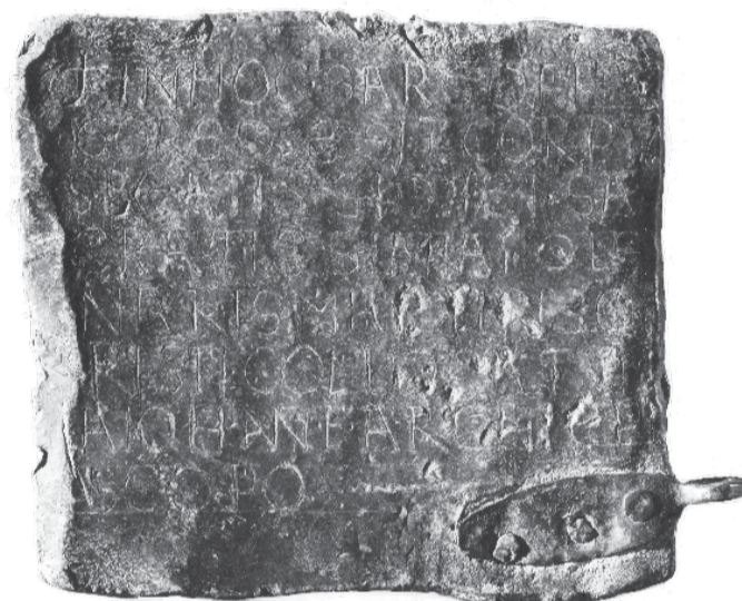
Immagine 3: la lastra in piombo che testimonia la presenza del nostro Patrono nella chiesa di Sant'Apollinare Nuovo

oltre alle tre lamine ricordate, vi è un altro riferimento a Sant'Apollinare, la parte superiore di un manifesto, realizzato da G. Minguzzi, che riunisce in una sorta di collage immagini ravennate