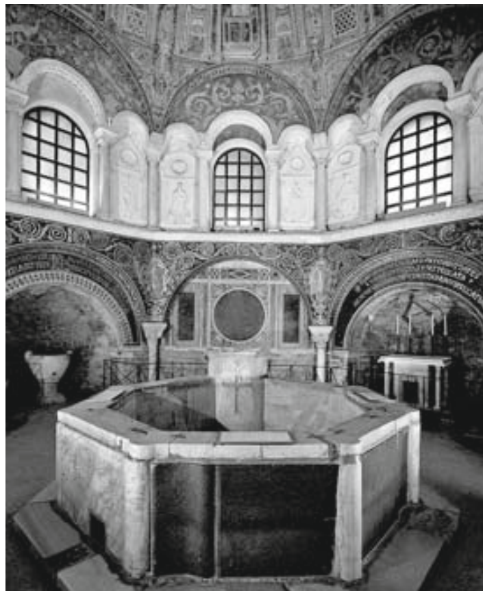
35. Battistero degli Ortodossi, la volta, Ravenna 36. Battistero degli Ortodossi, interno, Ravenna